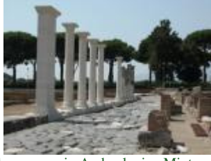
Comprensorio Archeologico Minturnae, colonnato